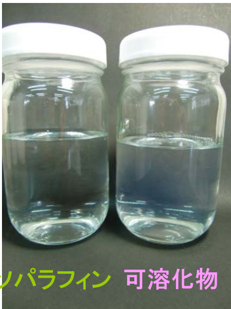
イソパラフィン 可溶化物